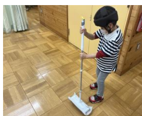
肢体不自由教育部門

今後も、全校で環境整備を進めていき、児童・生徒たちのよりよい成長につなげていく所存です。本校の子供たちの取組に「いいね！」を送っていただけると嬉しいです。